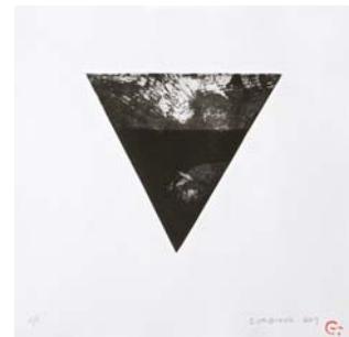
Venus I, Metal, 30x30 cm. 2009 Venus II, Metal, 30x30 cm. 2009 Venus III, Metal, 30x30 cm. 2009