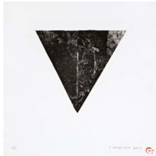
Venus IV, Metal, 30x30 cm. 2009 Venus V, Metal, 30x30 cm. 2009 Venus VI, Metal, 30x30 cm. 2009