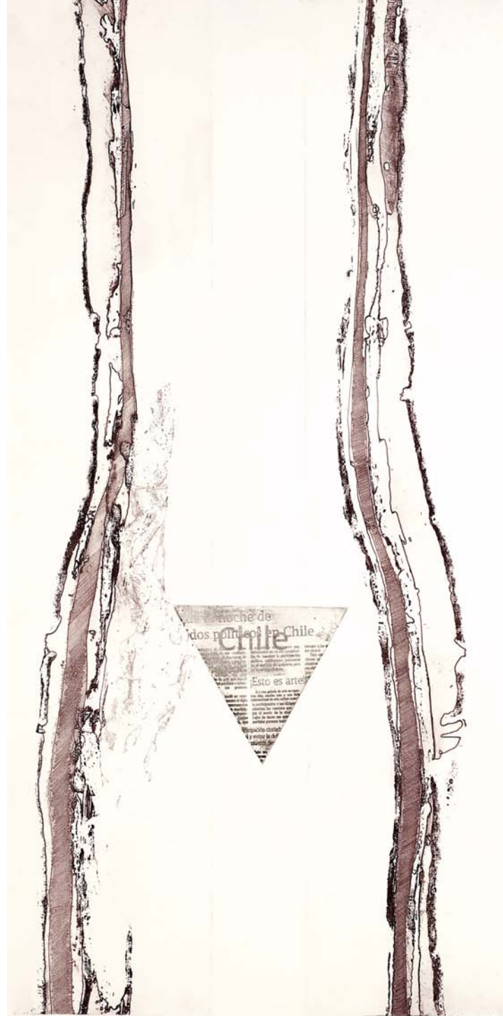
Mujer Chile Arte, Calcografía, 99x49 cm. 2009